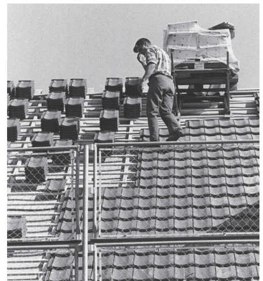
6 An Schrägdächern bietet eine Dachdeckerschutzwand mit Gittern einen idealen Schutz vor Absturz von Personen, Gegenständen und Materialien.

Es ist möglich, dass in Ihrem Betrieb noch weitere Gefahren zum Thema dieser Checkliste bestehen. Ist dies der Fall, treffen Sie die notwendigen Massnahmen (siehe letzte Seite).