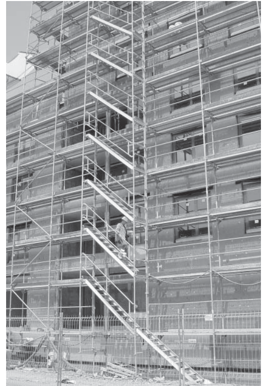
1 Markierte Verkehrswege tragen dazu bei, dass sie freigehalten werden.