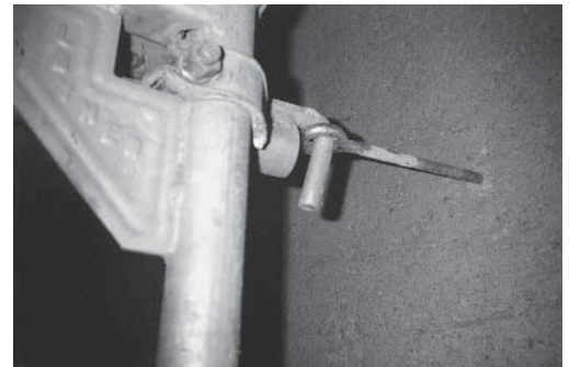
2 Zug- und druckfeste Verankerung, bestehend aus Bohrdübel und Ringschraube von genügender Tragfähigkeit.