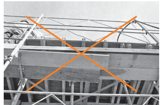
3 «Brettfallen» sind besonders heimtückisch, weil sie von oben nicht zu erkennen sind.