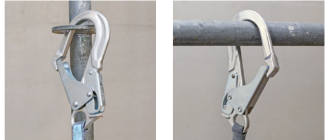
5 und 6 «Rohrhaken» dürfen nur senkrecht und ohne Querbelastung eingesetzt werden.