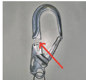
7 Quer belastete «Rohrhaken» können zu Bruch mit Absturz führen