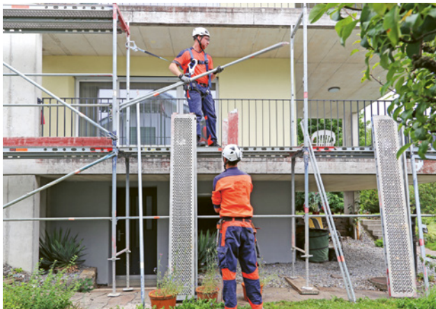
4 Montage mit der PSAgA